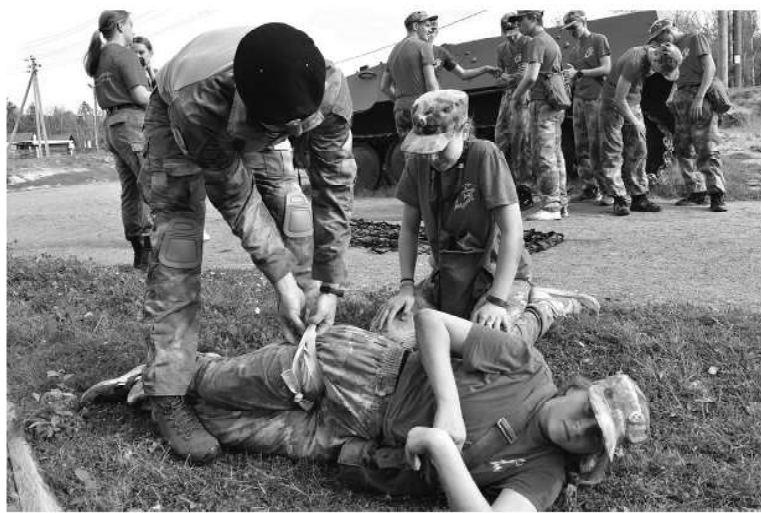
Занятия тактической медициной на «Тропе боевого братства»

среда формирования культурного человека.