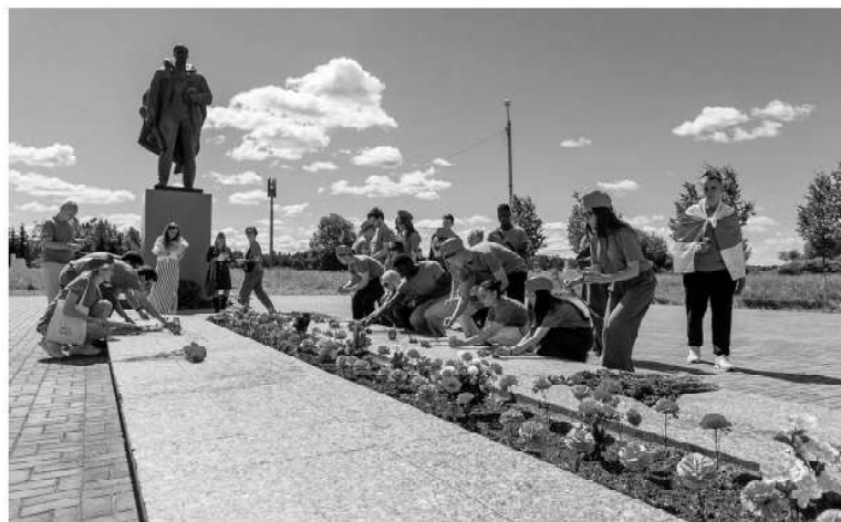
Молодёжь Ленинградской области принимает активное участие в патриотических акциях

БЕСЕДОВАЛА АНАСТАСИЯ КРУГЛОВА