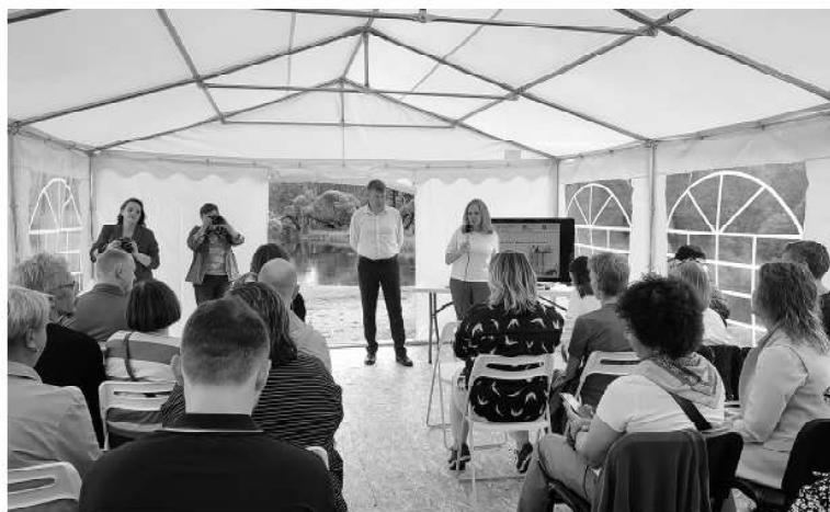
В музейном комплексе обсудили проект восстановления Форелевой башни