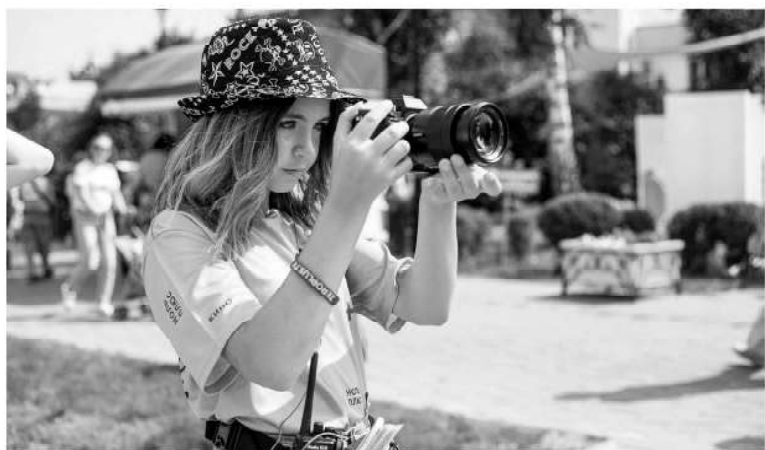
Юные ленинградцы снимают видеоролики о бережном отношении к природе