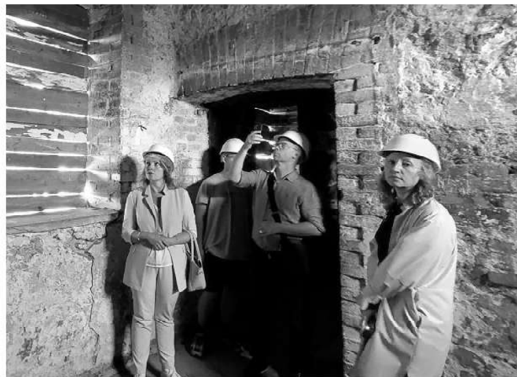
Ранее здесь никогда не проводились комплексные реставрационные работы