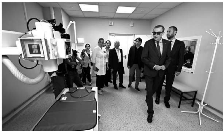
Новая амбулатория в Дубровке рассчитана на 110 посещений за смену