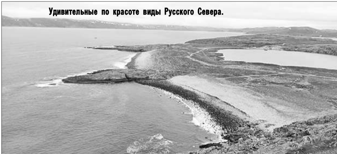
Удивительные по красоте виды Русского Севера.

Путь в Мурманск был нелегким, но насыщенным видами. Этот крупнейший город на Кольском полуострове впечатлил их своим уникальным климатом и захватывающими дух пейзажами. В Мурманске они посетили атомный ледокол «Ленин», ставший символом освоения Арктики. Запомнился, конечно, и мемориал «Защитникам Советского Заполярья в годы Великой Отечественной войны».