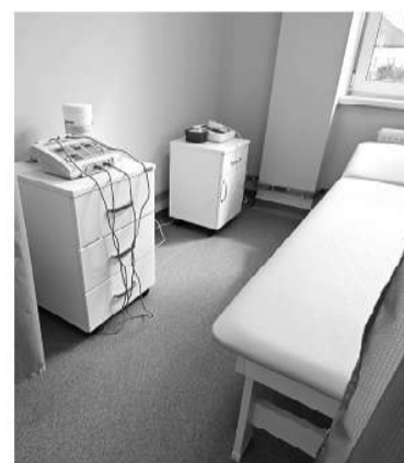
Регион закупает медицинское оборудование

АННА КАРПОВА