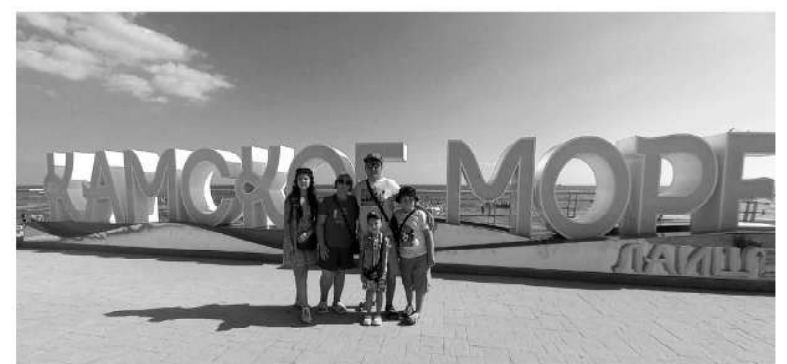
Совместные путешествия — любимая традиция многодетной семьи