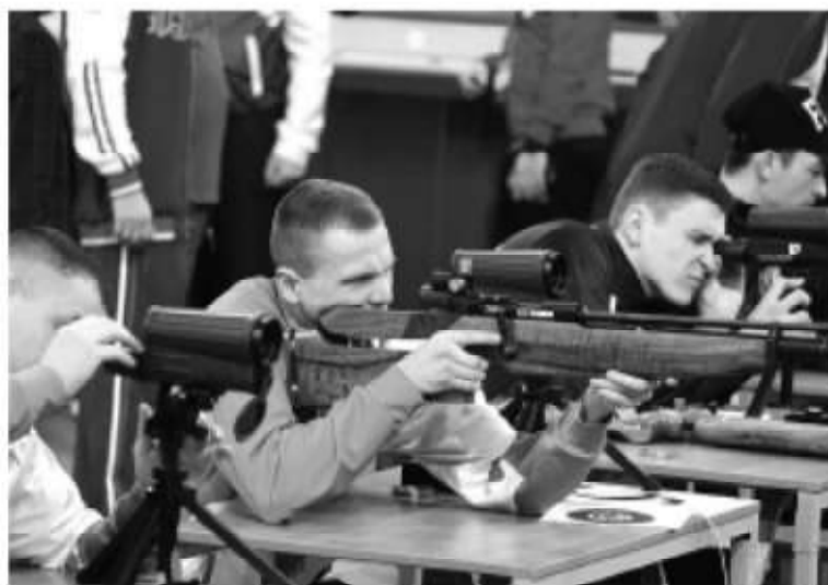
Ветераны соревновались в пулевой стрельбе, стрельбе из лука, пауэрлифтинге, настольном теннисе, армрестлинге и волейболе