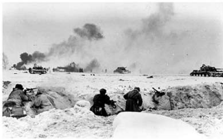
Бойцы Красной армии сдерживают натиск врага