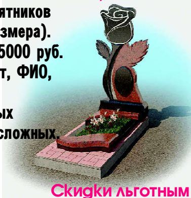
Скидки льготным категориям граждан.

Телефон магазина 8-921-886-34-06. Оформление похорон (низкие цены). Помощь в оформлении документов. Телефон 8-921-768-34-26.