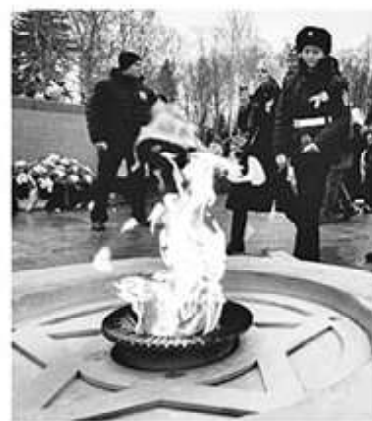
Годом ранее страна отмечала юбилей прорыва блокады

Командование союзных войск также восприняло эту победу