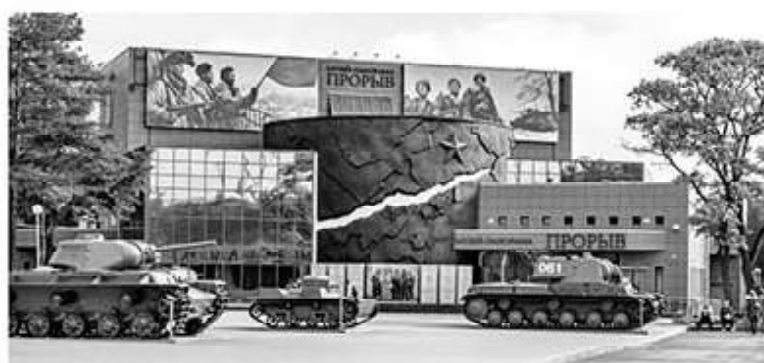
На 2024–2026 годы запланировано обновление музейного комплекса

Важно не забывать и про то, что Дорога жизни — это большое количество самых разных служб: ветеринары, дорожники, военная прокуратура, Ладожская военная флотилия, пограничники, аэросанные батальоны, буеристы, связные, которые доставляли донесения на мотоциклах... Хотелось бы рассказать посетителям музеев о работе этих служб, в том числе и в год 80-летия полного снятия блокады Ленинграда.