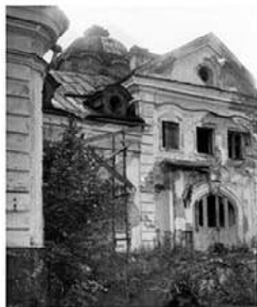
Историческая застройка Любани была уничтожена врагом

Губернатор Ленинградской области Александр Дрозденко подписал закон, который присваивает Любани звание Города воинской доблести. В документе отмечается трудовой, гражданский и ратный подвиг местных жителей и трудовых коллективов, а также мужество, героизм и высшая воинская доблесть, проявленные частями и соединениями Красной армии при обороне и освобождении города.