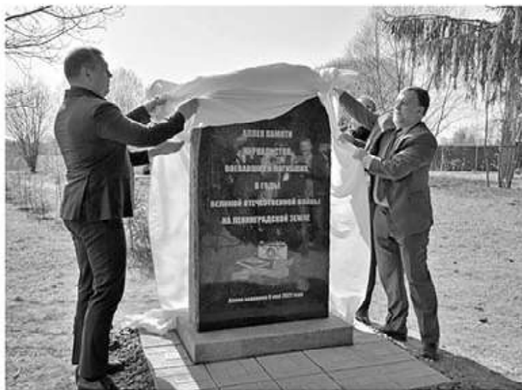
Открытие памятника военным журналистам, погибшим в годы войны

Сегодня Любань хранит память о подвиге Красной армии и страданиях мирных жителей. В городе расположены сразу несколько мемориалов, посвящённых событиям тех лет. В их числе — знаменитая «Берёзовая аллея» —