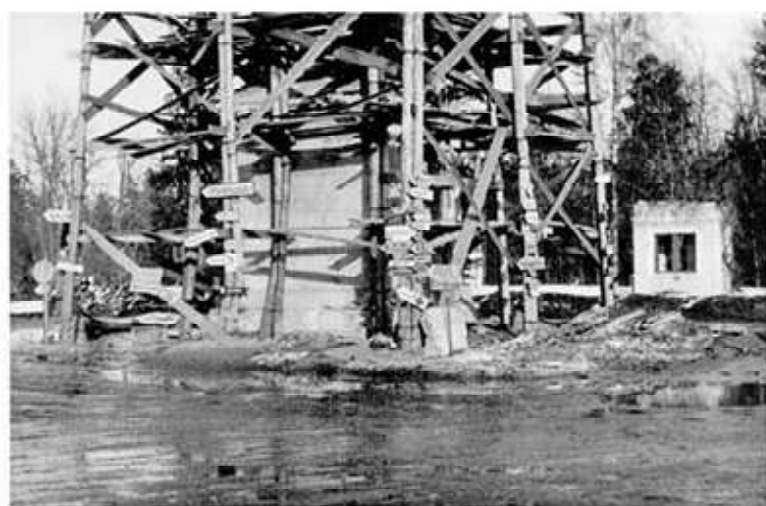
Коннетабль в Гатчине в годы немецкой оккупации