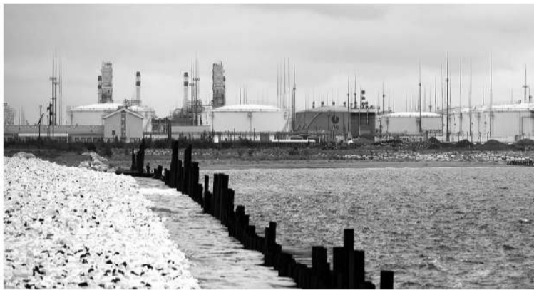
■ В порту Усть-Луга работают 18 морских грузовых терминалов