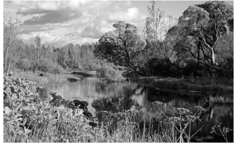
■ Проект «Тропа 47» объединяет свыше 40 уникальных природных маршрутов

Крупнейший терминал по производству и отгрузкам природ-