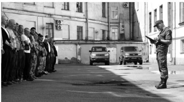
Мероприятие началось с построения и переключки добровольцев

— Уверен, что мои способности хорошего водителя там пригодятся. Знаю о ситуации «за ленточкой» от товарищей, которые уже побывали на фронте. Они, к счастью, вернулись домой живыми и здоровыми. И хотя наша служба, несомненно, связана с риском, я свой выбор сделал. Как говорится, есть такая профессия — Родину защищать, — делится своими мыслями житель Ленинградской области.