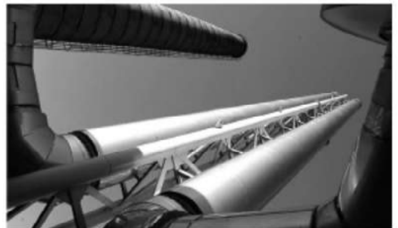
Котельные в районах переходят с угля и мазута на природный газ

ЗАПЛАНИРОВАНО НА 15 СЕНТЯБРЯ. С ЭТОГО МОМЕНТА ТЕПЛОСЕТИ ДОЛЖНЫ БЫТЬ ПОЛНОСТЬЮ ГОТОВЫ К РЕЖИМУ ПЕРИОДИЧЕСКОГО ПРОТАПЛИВАНИЯ