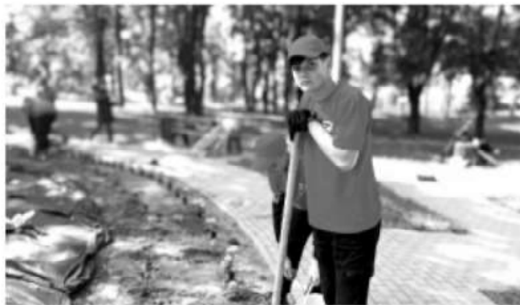
■ Старшеклассников привлекают к озеленению и уборке общественных территорий

Всего в Романовке трудятся две молодёжные бригады. В ка-