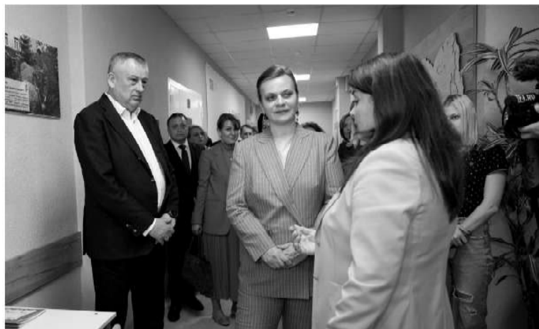
В работе фонда пригодится опыт Мультицентра социальной и трудовой интеграции

Что же смогут получить ветераны СВО, обратившись к специалистам фонда? Спектр социальных услуг — самый широкий. Это и санаторно-курортное лечение, и помощь с восстановлением утраченных документов, и обучение любой профессии вплоть до запуска своего бизнеса. Именно на «Защитников Отечества» возложен контроль за обеспечением ветеранов бо-