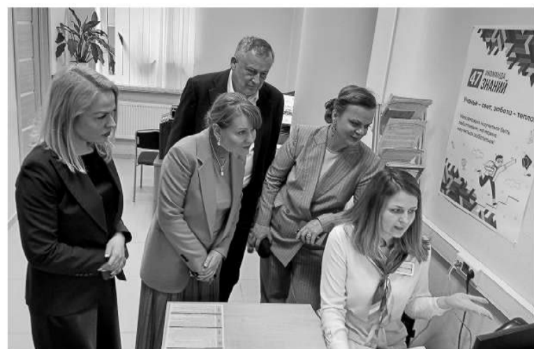
Ленинградский филиал фонда готовится к открытию

евых действий лекарствами и техническими средствами, не входящими в федеральный перечень льгот. Например, высокофункциональными протезами или мобильными колясками.