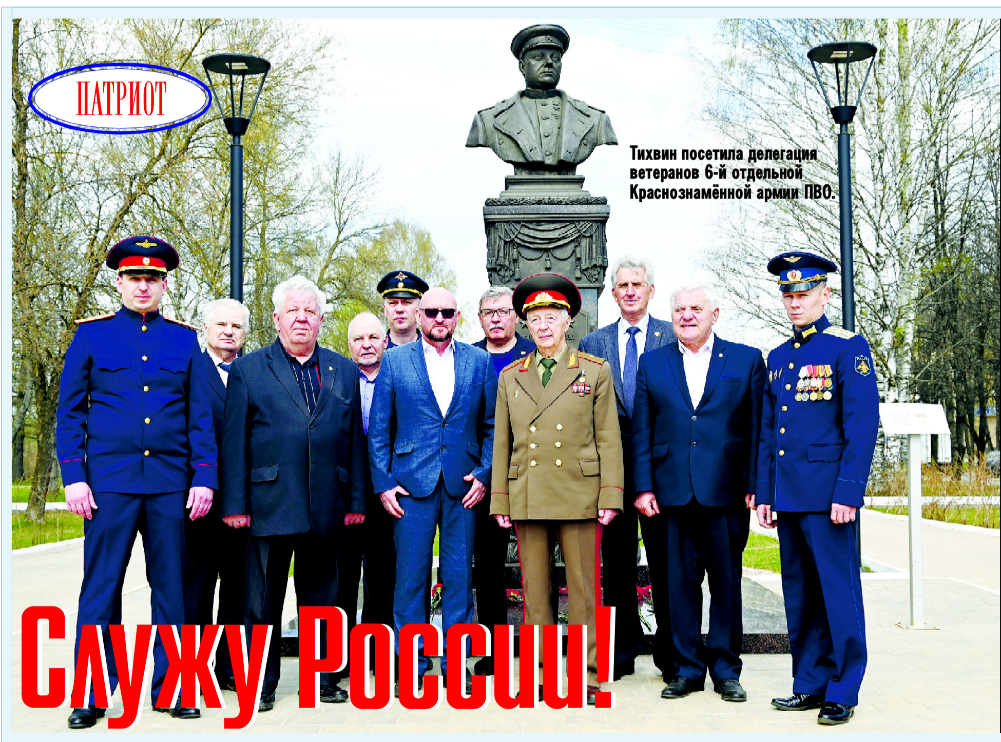
Тихвин посетила делегация ветеранов 6-й отдельной Краснознамённой армии ПВО.