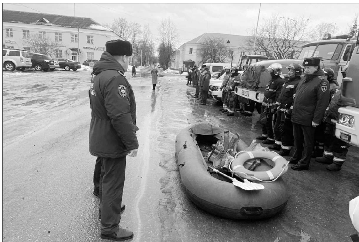
В Ленинградской области стартовали учения по проверке готовности служб к паводковому и пожароопасному сезонам.

Первая проверка состоялась 15 марта во время смотра готовности сил и средств, предназначенных для предотвращения сезонного риска и борьбы с последствиями. В Тихвине традиционное мероприятие состоялось на площади Свободы.