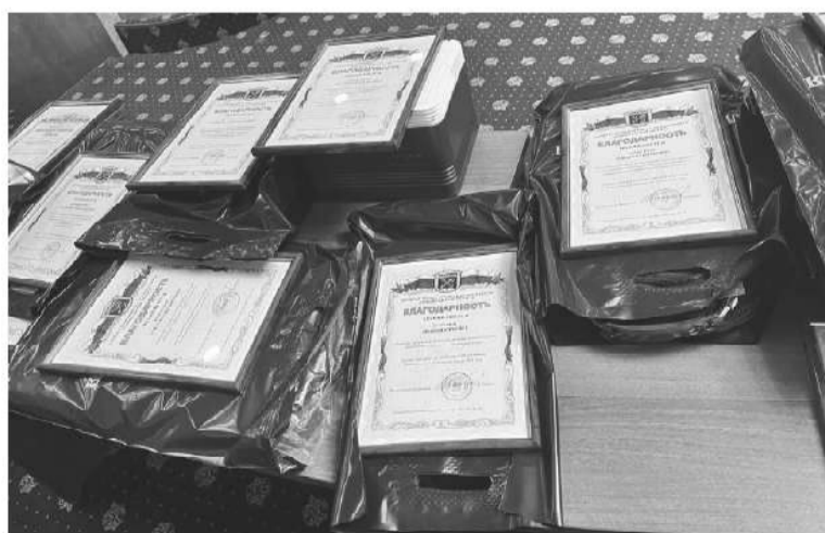
Всеволожский и Выборгский районы являются лидерами по количеству созданных дружин

Итоги года добровольцы подводили на заседании Штаба народных дружин Ленинградской области в региональном правительстве. Областное руководство высоко оценило вклад дружинников в поддержание спокойной жизни региона. Первый заместитель председателя комитета