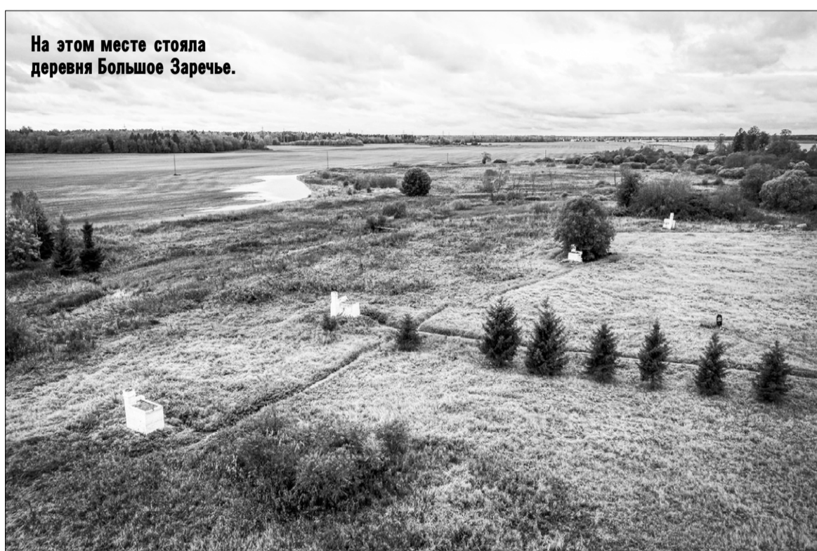
На этом месте стояла деревня Большое Заречье.

В 1943 году враг терпел поражение. Ленинградский фронт готовился к решающим боям, а нацисты породили бесчеловечный план выжженной пустыни, выполнение которого было намечено на октябрь – ноябрь. В ночь на 28 октября 1943 года после объявления захватчиками об отправке населения деревень округа на работы в Германию почти все население Большого Заречья