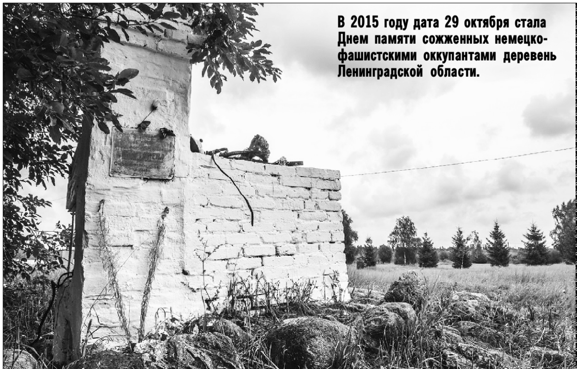
В 2015 году дата 29 октября стала Днем памяти сожженных немецко-фашистскими оккупантами деревень Ленинградской области.