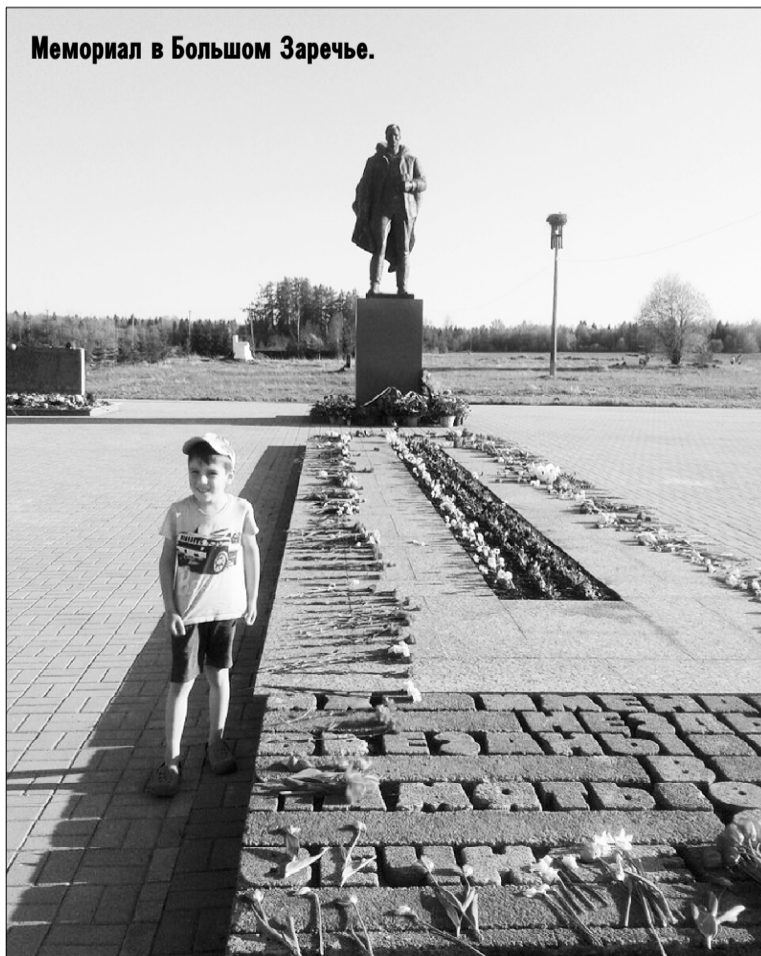
Мемориал в Большом Заречье.

ей, которая, как солдат-защитник Родины, не покорилась, а погибла в бою. Захоронены останки погибших людей в братской могиле в поселке Кикерино весной. Освободили деревню в январе 1944 года.