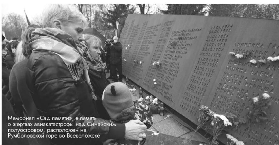
Мемориал «Сад памяти», в память о жертвах авиакатастрофы над Синайским полуостровом, расположен на Румболовской горе во Всеволожске

– Каждый год мы вместе с петербуржцами и жителями области возлагаем цветы у подножия памятника Детям Беслана в храме Успения Пресвятой Богородицы на Малоохтинском проспекте. Там же служим литургию. В этом году также приглашаем присоеди-