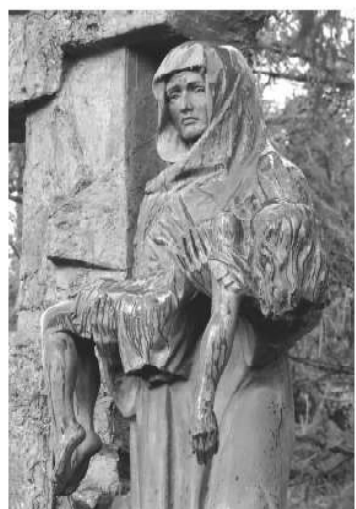
Памятник «Детям Беслана» в Малоохтинском парке