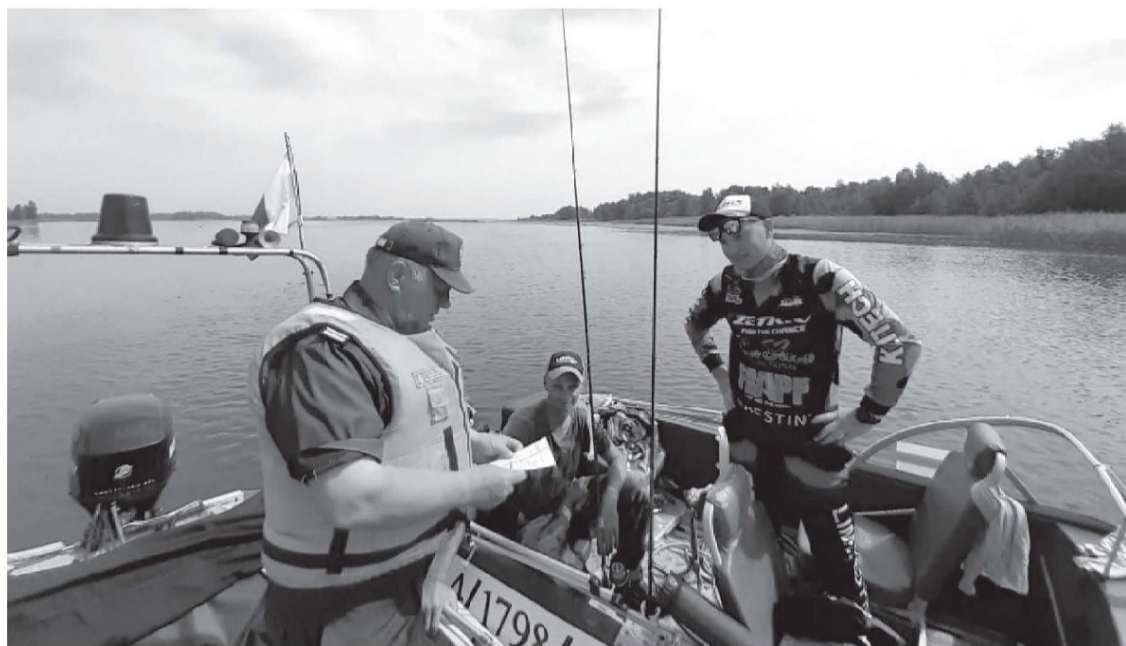
Во время рейдов инспекторам регулярно встречаются и законопослушные судоводители

Кстати, совместные рейды с полицейскими обусловлены