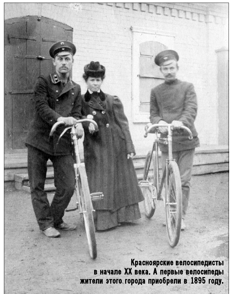
Красноярские велосипедисты в начале XX века. А первые велосипеды жители этого города приобрели в 1895 году.

Самокат – отличный подарок ребенку. Он позволит хорошо провести время и положительным образом скажется на способностях юного самокатчика: улучшит координацию, чувство равновесия, пробудит интерес к совместным поездкам и поможет освоиться в городской среде. И очень важно, чтобы родители не остановились только на покупке, а еще и помогли освоить самокат, благо катание на нем – дело простое! А самый лучший вариант – купить самокат себе и кататься вместе 47