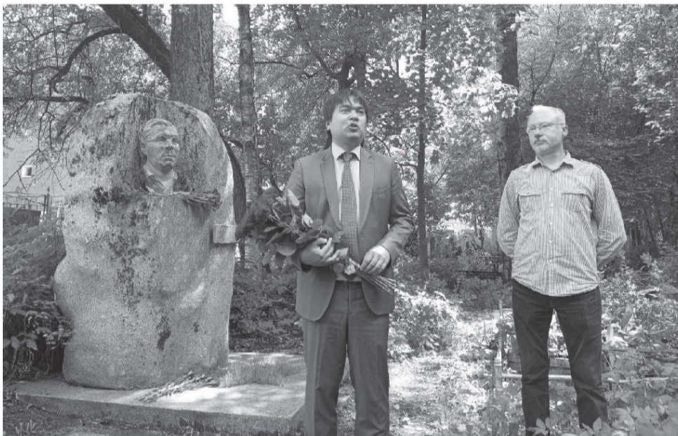
Бюст Григория Бумагина появился на Богословском кладбище в начале восьмидесятых. Но в девяностые годы неизвестные вандалы уничтожили памятник... Справедливость восстановили спустя 30 лет

Партизанские силы области на тот момент насчитывали около 14 тысяч человек. Этим людям ждал трудный подвиг. Ленинград оказался в кольце блокады, продовольствия на местах не хватало, да ещё и зима 1941-1942 годов выдалась по-настоящему суровой. Захватчики лютовали и