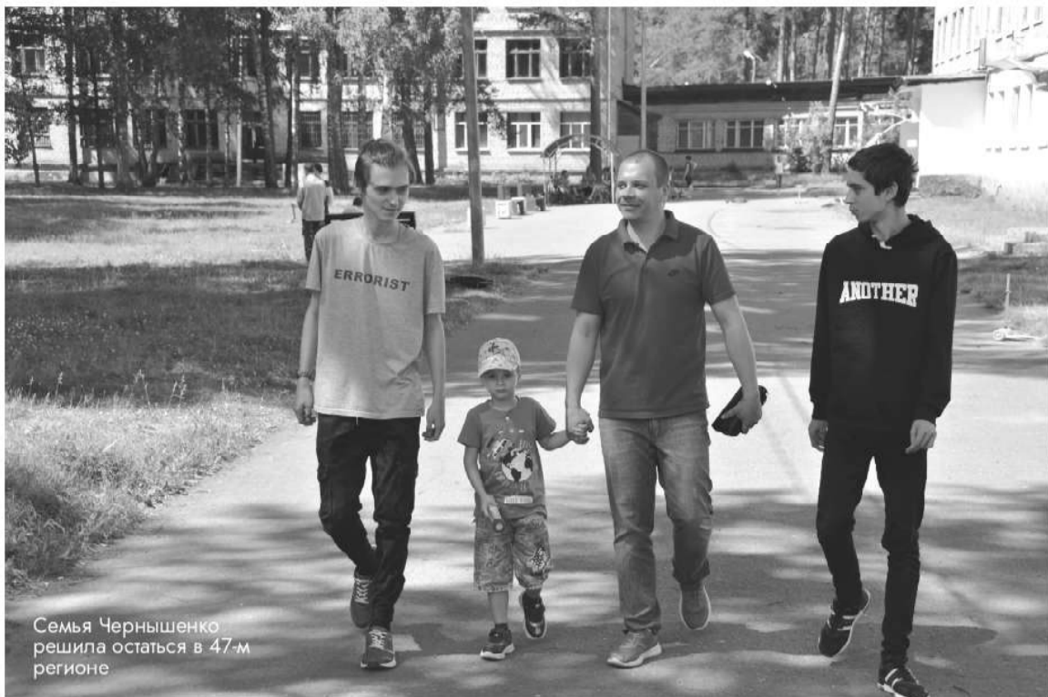
Семья Чернышенко решила остаться в 47-м регионе

– ПВР в Тихвинском районе – образец взаимодействия го-