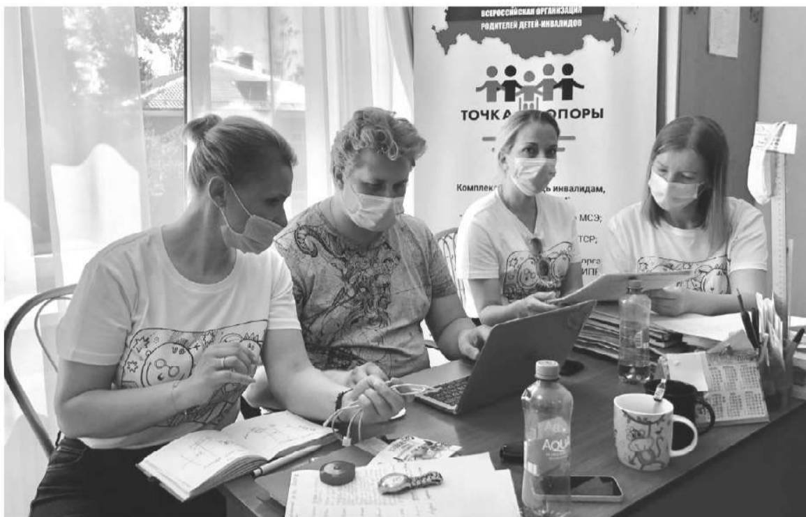
■ За время работы проекта в 2020-2021 годах помощь получили более 350 семей

— Мы поделимся опытом с врачами, которые там работают. Существует проблема: доктор не всегда владеет документами, которые регламентируют порядок заполнения направляющих документов на медико-социальную экспертизу. Ещё одна проблема — низкая информированность родителей о федеральных и региональных мерах соцподдержки, например о праве любого ребёнка на об-