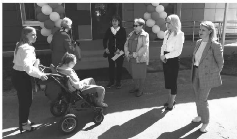
■ Комфортная жизнь для родственников людей с ограниченными возможностями — один из трендов социальной сферы Ленобласти

Продолжает работу и мобильная приемная соцзащиты, где консультируют жителей о мерах социальной поддержки. С 3 по 29 июня 2022 года такие консультации на местах прошли в Кингисеппе, Ивангороде, Усть-Луге и других населённых пунктах Кингисеппского района. Как отмечают специалисты, жители задают немало вопросов, поэтому данная форма работы является эффективной.