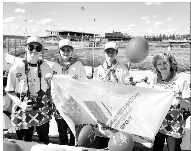
Материалы, отмеченные значком ®, публикуются на правах рекламы.