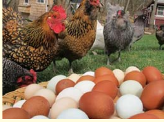
ИП Тихвин Р.С.