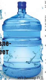
Сертификат соответствия №1417971 от 15.05.2015 г.

Наша вода – мягкая и приятная на вкус, при ее кипячении совершенно не образуется накипь. Ее можно пить без кипячения. Рекомендуется для приготовления пищи, для людей любого возраста, имеет достаточно низкий уровень минерализации, что позволяет пить воду в неограниченном количестве без ущерба для здоровья.