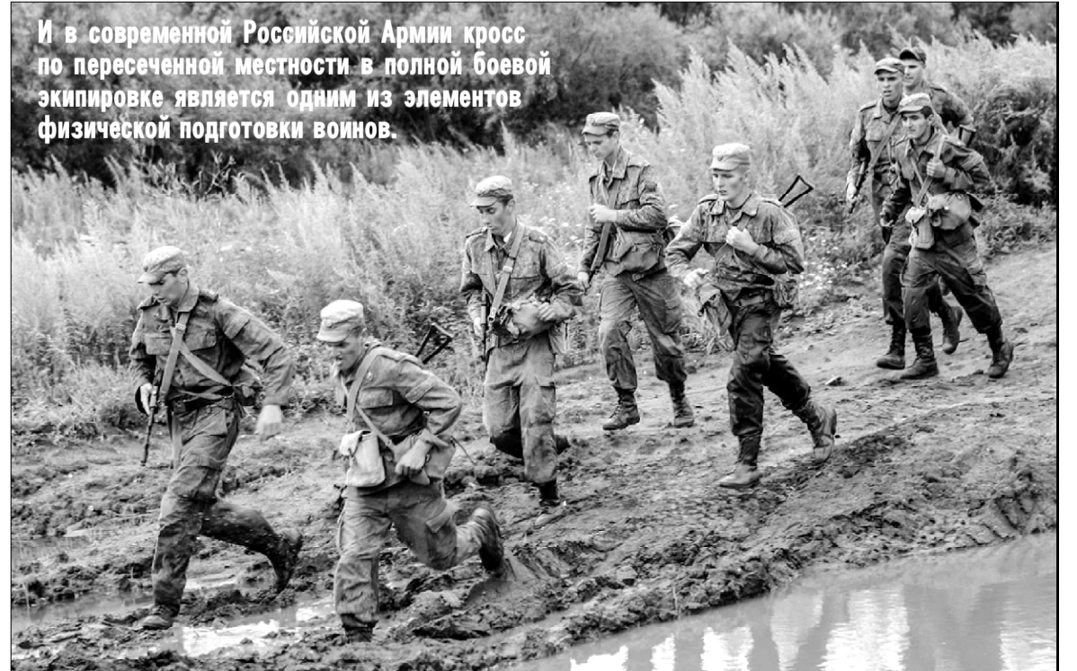
И в современной Российской Армии кросс по пересеченной местности в полной боевой экипировке является одним из элементов физической подготовки воинов.

В батальоне на высоком уровне была поставлена физическая подготовка военнослужащих. И прежде чем новоиспеченному солдату доверили выступить в лыжных гонках первенства Ломоносовского района (в то время существовала практика участия в территориальных соревнованиях воинских частей, квартировавших в том или ином городе, районе), с него сошло семь потов в проводимых баталь-