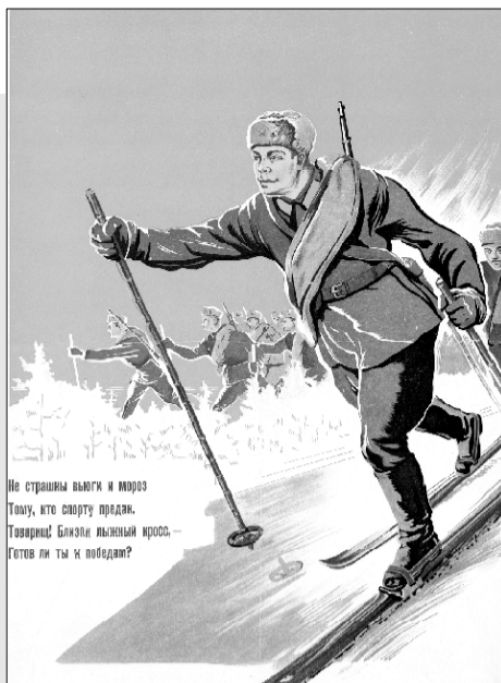
Не страшны лыжи и инвентарь. Тому, кто смерть продает. Тавриец! Ближе лыжный кросс – Гатов ли ты к победам?

■ Законопроект о корректировке демпфирующего механизма оптового топливного рынка согласован в правительстве и внесен в Госдуму. Решено увеличить компенсации из бюджета в пользу нефтяных компаний, чтобы сдерживать рост розничных цен на бензин и дизель в пределах инфляции. Планируется, что изменения вступят в силу с апреля. По информации Минфина, решение принято на фоне макроэкономических условий. Из-за соотношения курса рубля и растущих цен на нефть экспорт продукции стал более привлекательным, чем поставки на внутренний рынок, что оказало давление на внутренние цены.