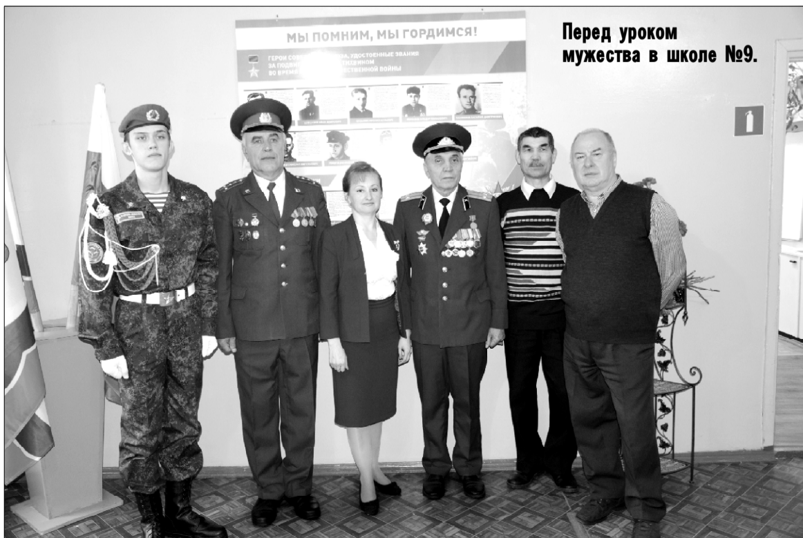
Перед уроком мужества в школе №9.

Голосование идет с 7 по 25 февраля на портале vMeste47.rf . Участвовать в нем могут жители в возрасте от 14 лет. Территории, победившие в голосовании, планируется благоустроить по федеральному проекту «Формирование комфортной городской среды» нацпроекта «Жилье и городская среда» в 2023 году. А в 2022 пройдут работы на 77 общественных территориях – в парках, на набережных, площадях, спортивных и детских пространствах.