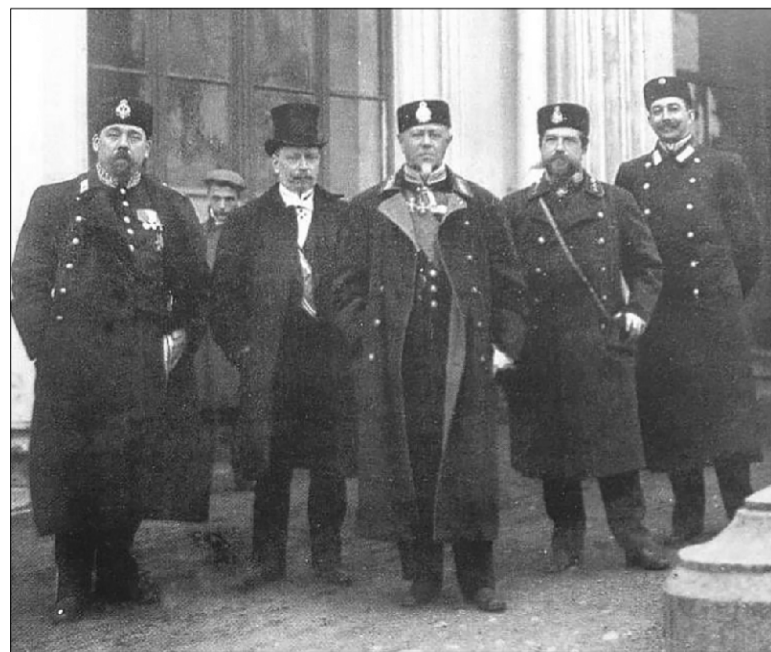
Михаил Иванович Хилков (в центре) с сослуживцами.

тей сообщения, пока 31 июня 1894 года не назначили главным инспектором железных дорог, а через полгода — руководителем ведомства. С назначением М.И.Хилкова министром работа здесь приняла крайне интенсивный характер. Меньше чем за десять лет протяженность железных дорог в России выросла с 35 до 60 тысяч километров, ежегодно возводили до 2,5 тысячи километров дорог (таких темпов не было даже в советский период). Одна из новых магистралей была проложена через наш город, за что Михаил Иванович Хилков и его сподвижники С.Ю.Витте и И.А.Милютин были первыми удостоены звания «Почетный гражданин города Тихвина».