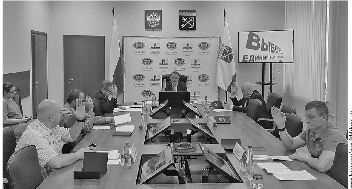
На заседании Леноблизбиркома

Проголосовать на дому можно по уважительным причинам, таким как состояние здоровья, инвалидность и т. д. Для этого нужно подать заявление в участковую избирательную комиссию с 9 сентября до 14 часов 19 сентября. Сделать это можно письменно, по телефону, через других лиц или через портал «Госуслуги».