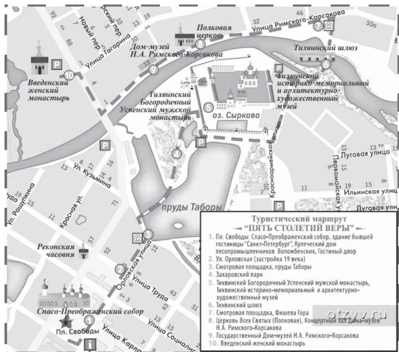
Карта туристического маршрута «Пять столетий веры».