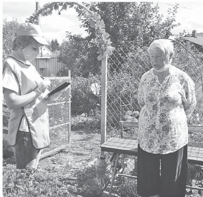
«СЕЛЬСКОХОЗЯЙСТВЕННАЯ МИКРОПЕРЕПИСЬ ПРИЗВАНА ОЦЕНИТЬ СТРУКТУРНЫЕ ИЗМЕНЕНИЯ, КОТОРЫЕ ЗА ПОСЛЕДНИЕ ПЯТЬ ЛЕТ ПРОИЗОШЛИ В АГРАРНОЙ ОТРАСЛИ РЕГИОНА. ЭТИ СВЕДЕНИЯ ЛЯГУТ В ОСНОВУ ПРОГНОЗА СОЦИАЛЬНО-ЭКОНОМИЧЕСКОГО РАЗВИТИЯ СЕЛЬСКОГО ХОЗЯЙСТВА».