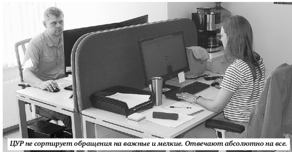
ЦУР не сортирует обращения на важные и мелкие. Отвечают абсолютно на все.

Все обращения структурируют по отраслям и направляют в профильные ведомства.