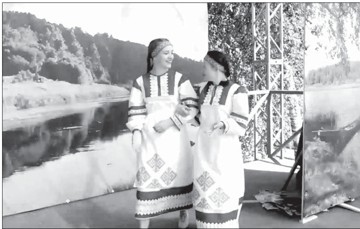
Материалы, отмеченные значком ©, публикуются на правах рекламы.

Праздник прошел в 35-й раз и был организован при поддержке областного комитета по местному самоуправлению, межрегиональным и межконфессиональным отношениям и комитета по культуре и туризму Ленинградской области.