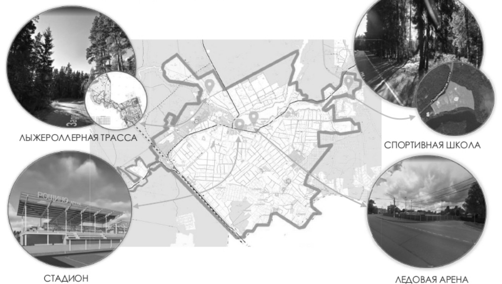
ГРАНИЦЫ КОНЦЕПЦИИ ОБЪЕКТЫ КОНЦЕПЦИИ И СУЩЕСТВУЮЩЕЕ СОСТОЯНИЕ

«Эти площадки не будут ограничены только спортивным ядром. Важно разместить их в границах всего населенного пункта, что даст жителям и гостям Рощино больше возможностей для занятий физкультурой и спортом».