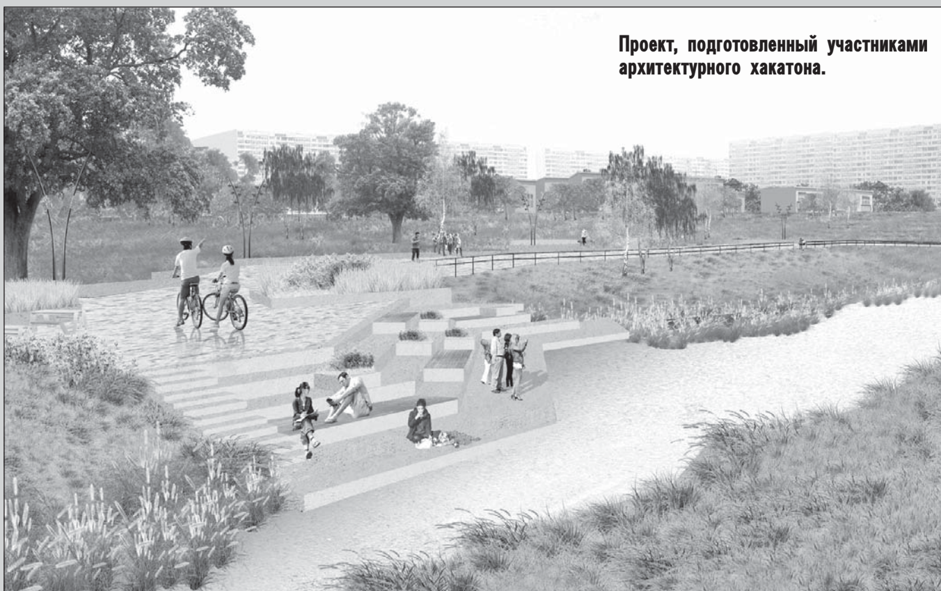
Проект, подготовленный участниками архитектурного хакатона.