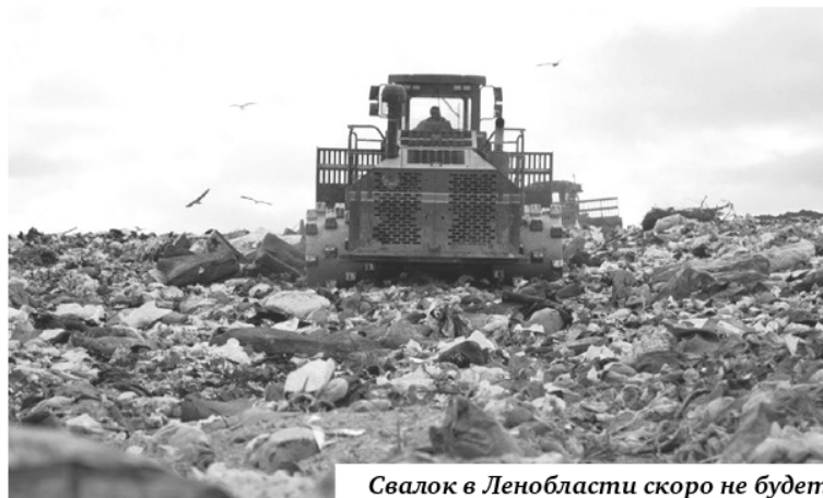
Свалок в Ленобласти скоро не будет