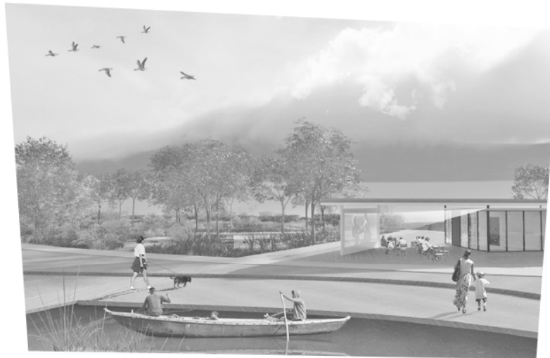
Изюминками рекреационной зоны у реки Ижоры в центре города Коммунар станут дорожка вокруг яблоняного сада, высаженного в послевоенные годы, лодочный пирс, прибрежный променада, который выложат террасной доской, и спортивная площадка.

рабатывают дизайн-проекты победивших территорий.