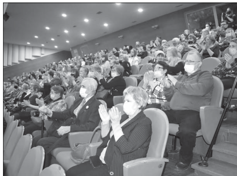
Материалы, отмеченные значком @, публикуются на правах рекламы.

Тихвинские зрители остались довольны от полученных ярких эмоций, они с радостью делились друг с другом впечатлениями, и казалось, что затяжная зима на время отступила, а серое тихвинское небо стало немногим другим, чуть красочнее и добрее.