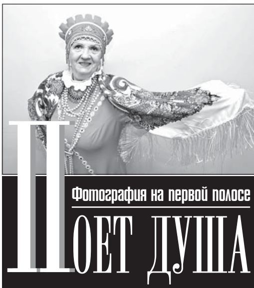
Фотография на первой полосе