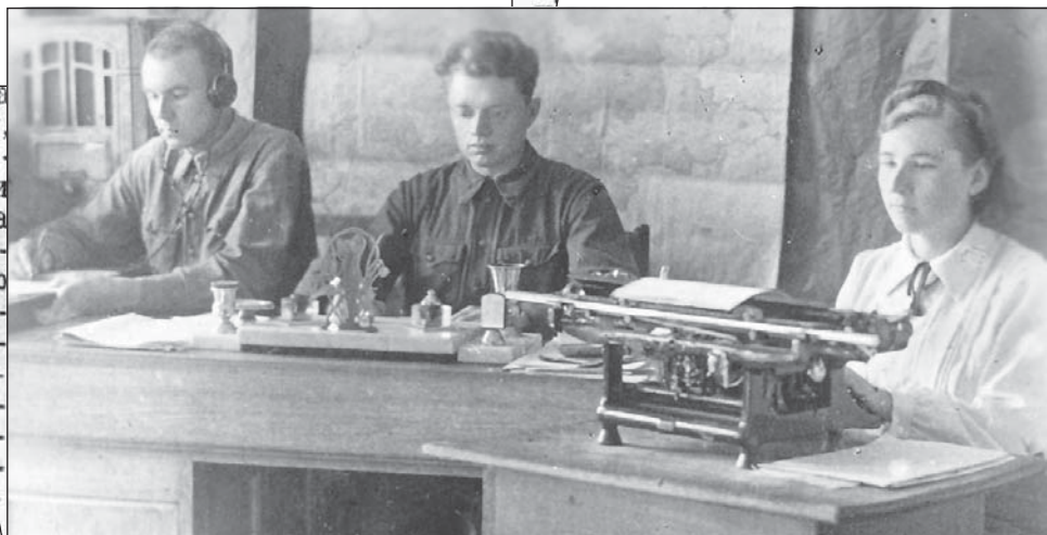
...ми не закреплены.

«В ответ на сообщение по радио о безоговорочной капитуляции германских войск колхозники Новинского, Сапожковского, Андреевского, Городокского, Ругуйского и других сельсоветов взяли обязательство провести высочайшего качества и в сжатые сроки, вырастить выскокачественный и обильный урожай» (10 мая 1945 года).