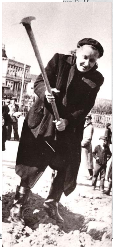
Коллективы рабочих и служащих