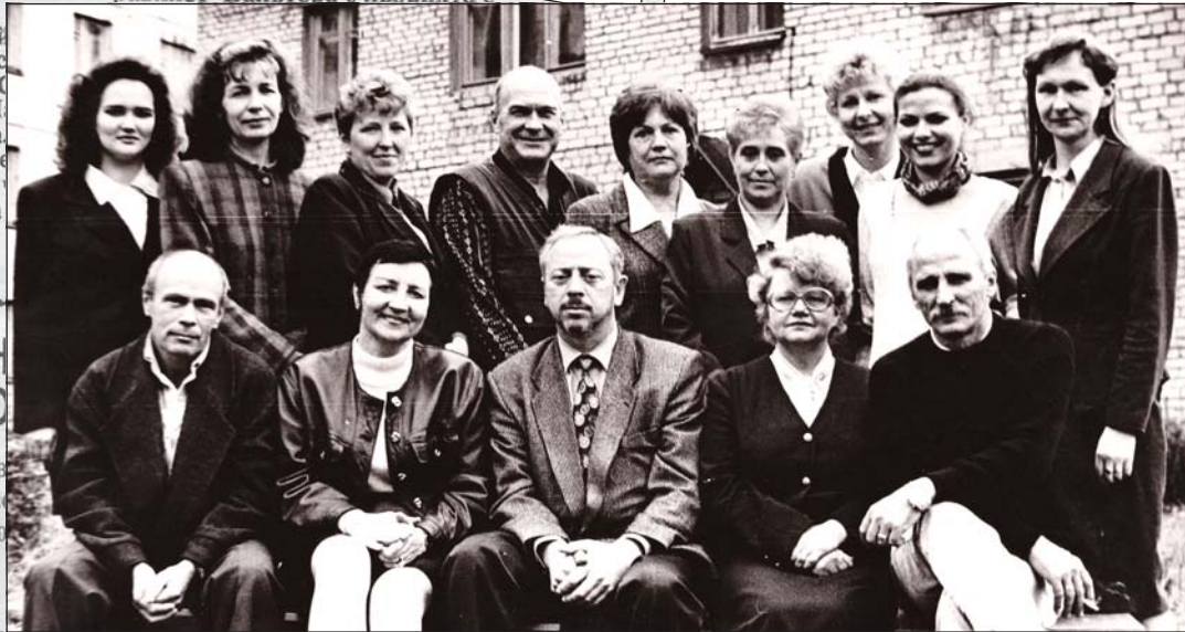
2000 год. Таким был коллектив «Трудовой славы» в год 70-летия газеты. Юбилейная фотография.