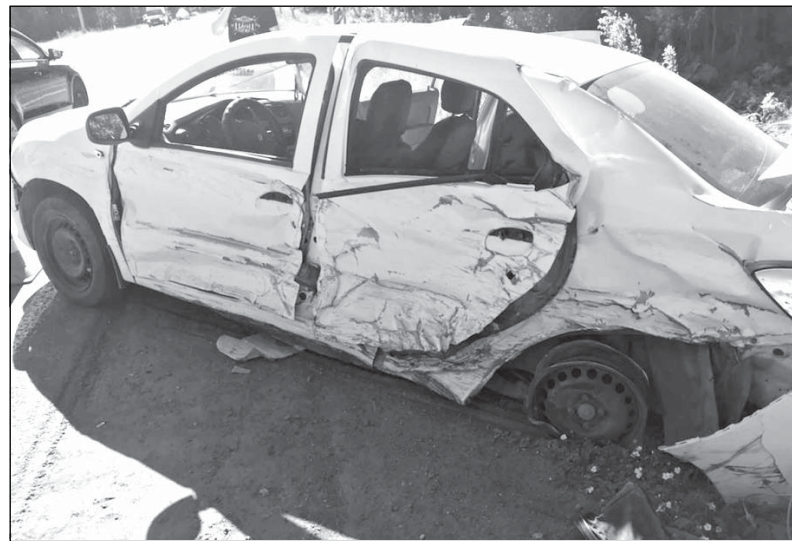
После аварии на автомобильной дороге Вологда – Новая Ладога.

Это дорожно-транспортное происшествие произошло 14 июня в 14 часов 50 минут в Тихвинском