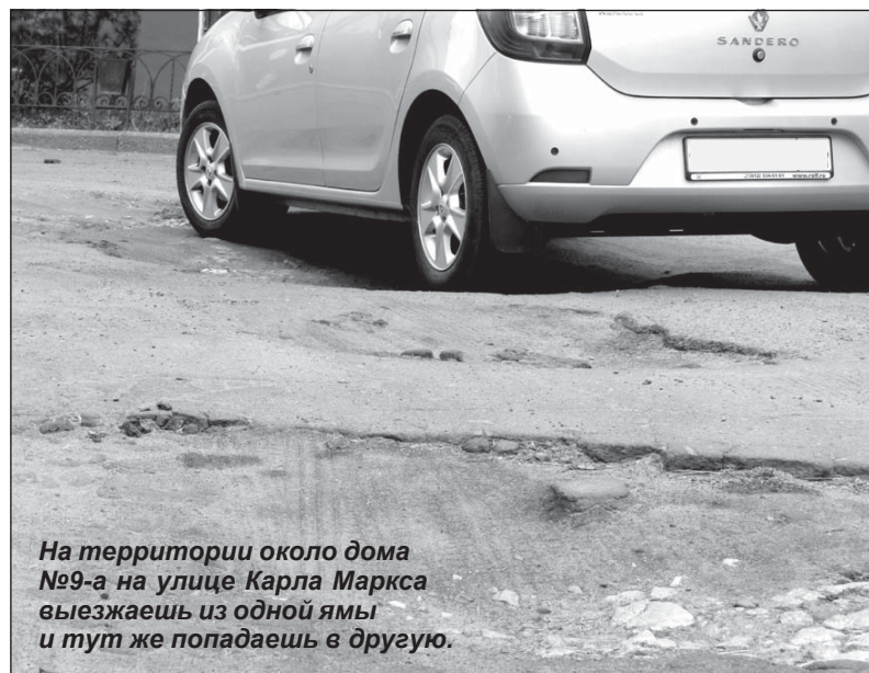
На территории около дома №9-а на улице Карла Маркса выезжаешь из одной ямы и тут же попадаешь в другую.