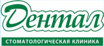
График режима в рабочие дни уточняйте по телефонам: 8-952-263-48-07, 55-101, 58-844. Воскресенье – выходной.

Лицензия ЛО-47-000-677 от 14 ноября 2012 года, выдана комитетом по здравоохранению Ленинградской области.