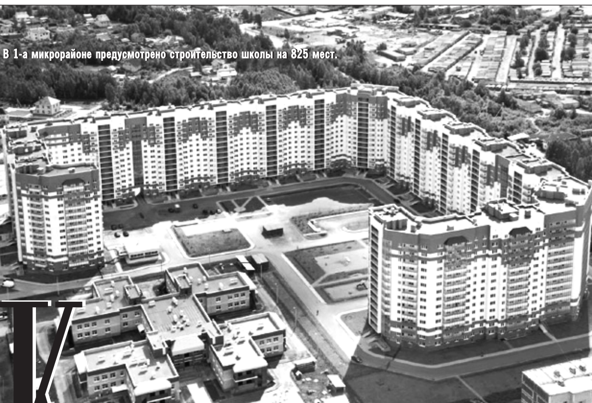
В 1-а микрорайоне предусмотрено строительство школы на 825 мест.

Важно не забывать об основной функции Счетной палаты — контроле за эффективностью использования бюджетных средств, заметила вице-премьер Татьяна Голикова. Это всегда остается приоритетом СП, заверил Кудрин.