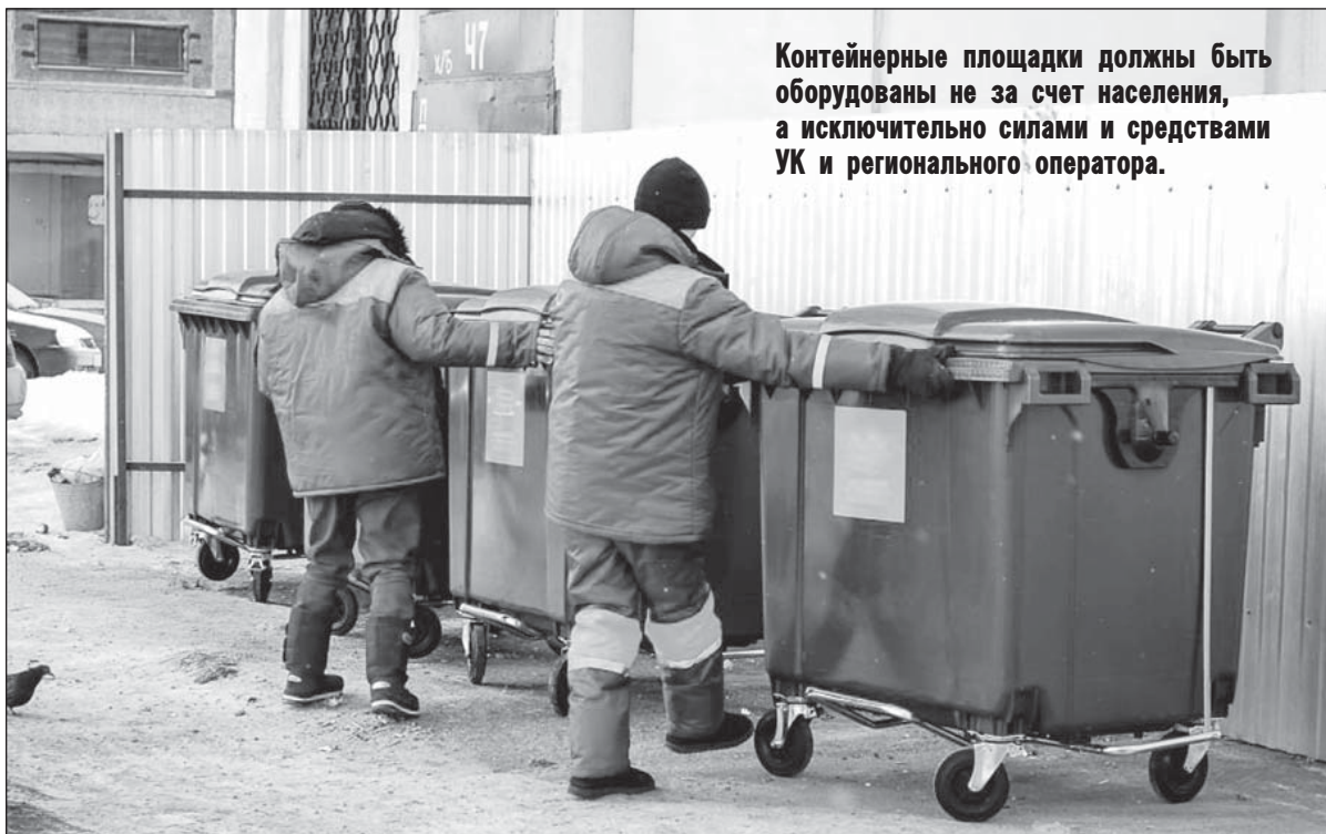
Контейнерные площадки должны быть оборудованы не за счет населения, а исключительно силами и средствами УК и регионального оператора.

Наказание получили и владельцы собак, выгуливавшие своих четвероногих питомцев без поводка и намордника, граждане, осуществляющие торговлю в неполюженном месте. Это касается как городских, так и сельских жителей.