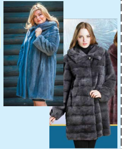
ИП Москулина А.П.

Все подробности вы можете получить на нашем сайте: meha-vyatka.ru или по телефону бесплатной горячей линии 8-800-222-24-15 .