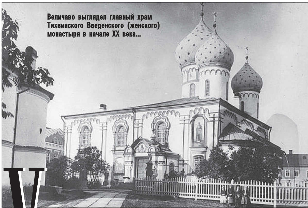
Величаво выглядел главный храм Тихвинского Введенского (женского) монастыря в начале XX века...