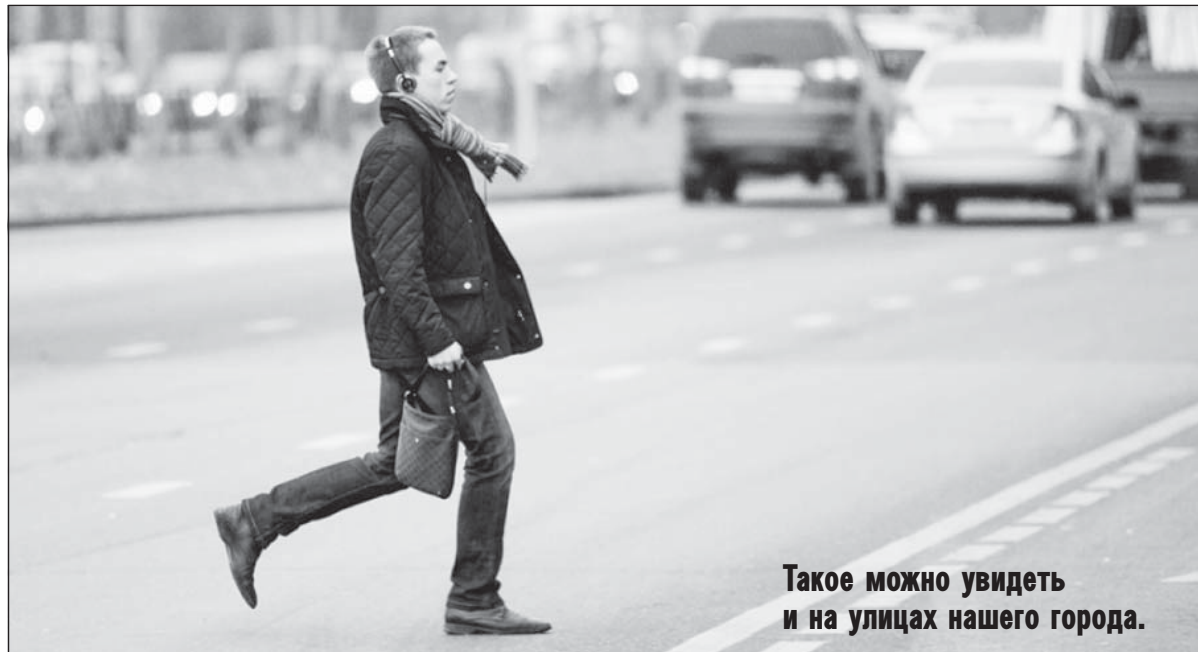
Такое можно увидеть и на улицах нашего города.