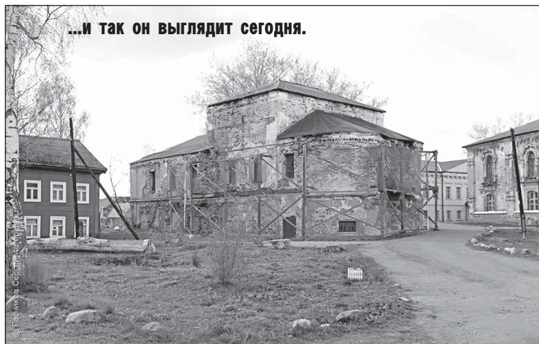
...и так он выглядит сегодня.