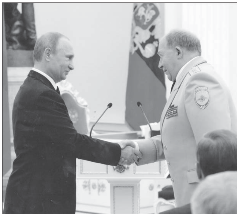
В Кремле на вручении государственной награды.

рожными инспекторами. За неуемную энергию, упрямство и настойчивость шестнадцатилетнего подростка выбрали командиром общественного отряда мотоциклистов, который помогал местному отделению Госавтоинспекции поддерживать порядок на дорогах. Так для него началась пока внештатная служба на дорогах.