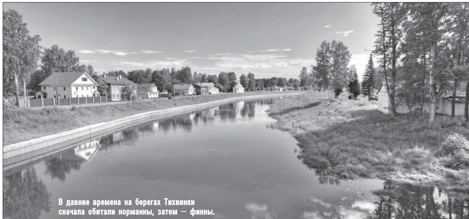
В давние времена на берегах Тихвинки сначала обитали норманны, затем – финны.