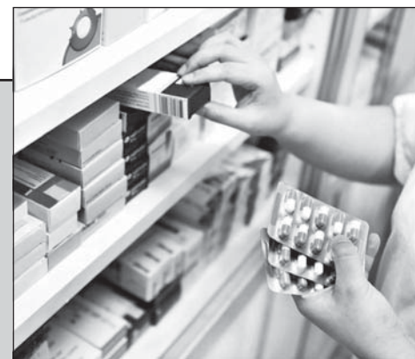
Госдума ввела обязательную маркировку лекарств с 1 июля 2020 года.

Производитель в споре с ФАС дошел до Верховного суда, но проиграл иск. Цену на лекарство «Нексиум» снизили в 13 раз