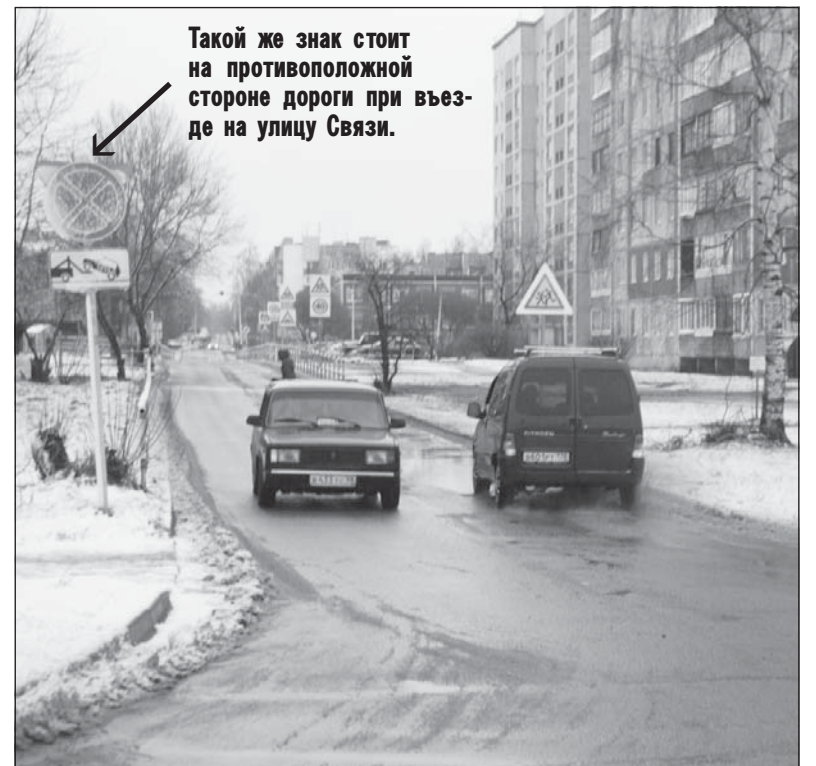
Такой же знак стоит на противоположной стороне дороги при въезде на улицу Связи.

двух сторон установили дорожный знак 3.27 «Остановка запрещена», под ним – табличку «Эвакуатор». Спрашивается, зачем, если на этом узком участке дороги и без того редко кто останавливался, а теперь, когда вдоль нее смонтировали металлическое ограждение, какой же ненормальный будет здесь стоять? Не впуская ли потрачены средства? Зато на выезде с улиц Связи, Школьной и Ново-Вязитской так и не появился дорожный знак «Стоп». А он, безусловно, притормозил бы высквакивающих из микрорайона автолхачей и обезопасил пешеходов [47]