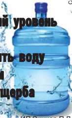
ИП Зиннер П.Д.

Наша вода — мягкая и приятная на вкус, при ее кипячении совершенно не образуется накипь. Ее можно пить без кипячения. Рекомендуются для приготовления пищи, для людей любого возраста, имеет достаточно низкий уровень минерализации, что позволяет пить воду в неограниченном количестве без ущерба для здоровья.