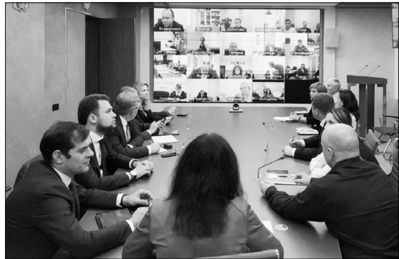
Продолжается работа штаба по переходу Ленинградской области на цифровое телевидение. В октябре совещания в ситуационном центре губернатора проходят ежедневно.

В числе участников оперативного штаба – представители Минкомсвязи РФ, региональных комитетов цифрового развития, печати, молодежной политики, социальной защиты населения, а также ФГУП «Российская телевизионная и радиовещательная сеть» и ФГУП «Почта России». На связи – представители муниципальных районов. Основная задача оперативного штаба – обеспечение комфортного перехода жителей на прием двадцати обязательных общедоступных телеканалов в современном цифровом формате. Для того, чтобы смена телевизионных форматов прошла без потрясений, принято немало как технических, так и управленческих решений. Это и прямая социальная поддержка малообеспеченных, и организация работы волонтеров, которые по обращению людей выходят на места и помогают в настройке оборудования, а также мониторинг наличия цифровых приставок в почтовых