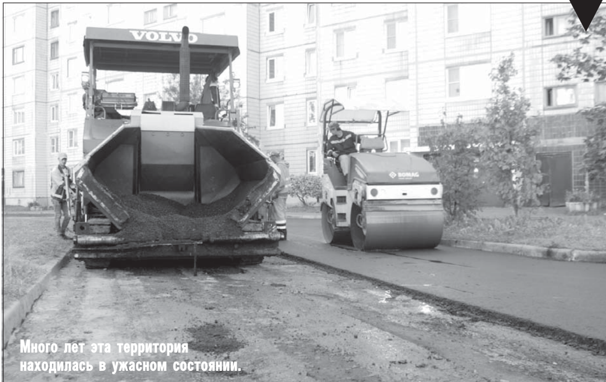
Много лет эта территория находилась в ужасном состоянии.

В планах районной администрации на ближайшие пять лет – разработка и реализация проекта уличного освещения на въезде в город по трассе Кириши – Лодейное Поле.