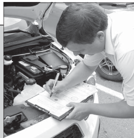
любых регистрационных действий доверенное лицо владельца машины впредь обязано предъявить оригинал паспорта собственника.

Кроме того, при обращении в подразделение Госавтоинспекции для проведения