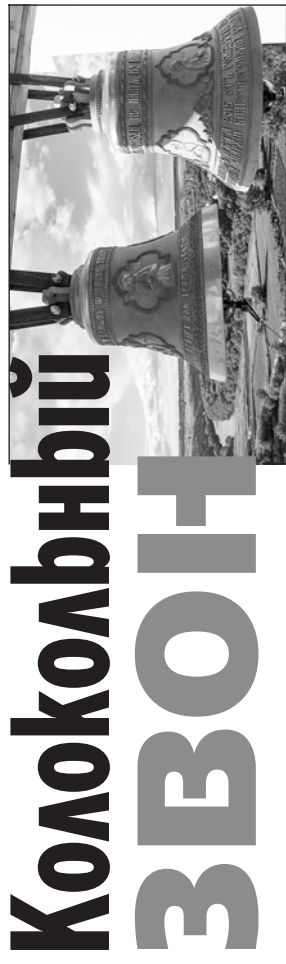
1-я стр. ➔

➤ Применение соды. При диагнозе «ревматоидный артрит» лечение народными средствами иногда предполагает применение пищевой соды. Правда, такая методика пока не приобрела официального одобрения эффективности. Некоторые поклонники нетрадиционных методов лечения утверждают, что сода способствует тому, чтобы вредные вещества отложились в суставах быстрее. Для этого четверть чайной ложки порошка растворяют в одном стакане кипятка, охлаждают и принимают каждые 12 часов.