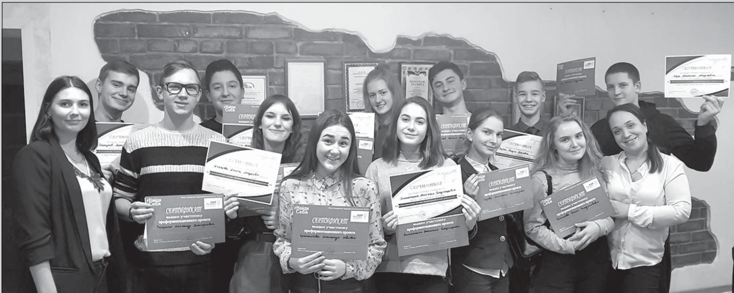
Более 30 подростков и 15 молодых предпринимателей приняли участие в проекте «Найди себя». Ребята прошли полный курс занятий по экономическим основам предпринимательской деятельности, попробовали свои силы в индивидуальной работе у предпринимателей города, составили свои бизнес-проекты и защитили их.

Наша страничка «Мой бизнес» зарегистрирована в Интернете. Здесь можно найти все свежие новости о предпринимательской деятельности, информацию о предстоящих и состоявшихся мероприятиях [87]