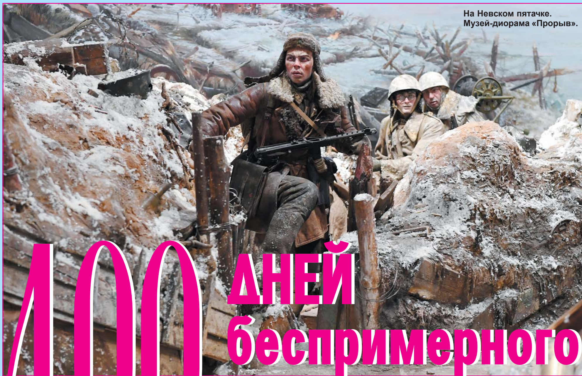
На Невском пятачке. Музей-диорама «Прорыв».