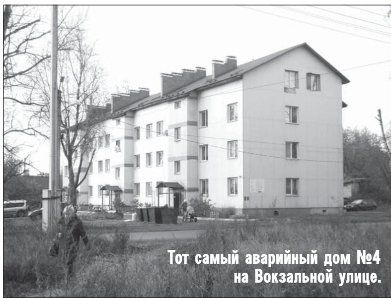
Тот самый аварийный дом №4 на Вокзальной улице.

2018-й – Год добровольца и волонтера в России