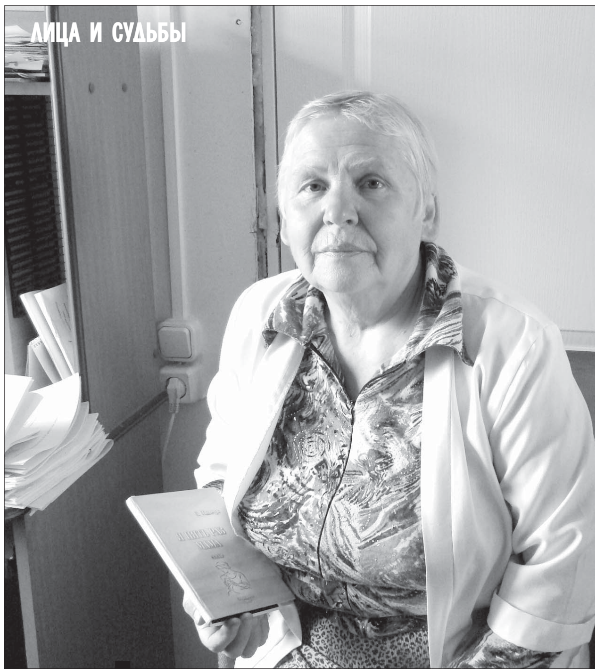
ЛИЦА И СУДЬБЫ

Учась в училище на машиниста башенного крана, кстати, на базе 10-летнего образования, я справилась лучше некоторых окончивших