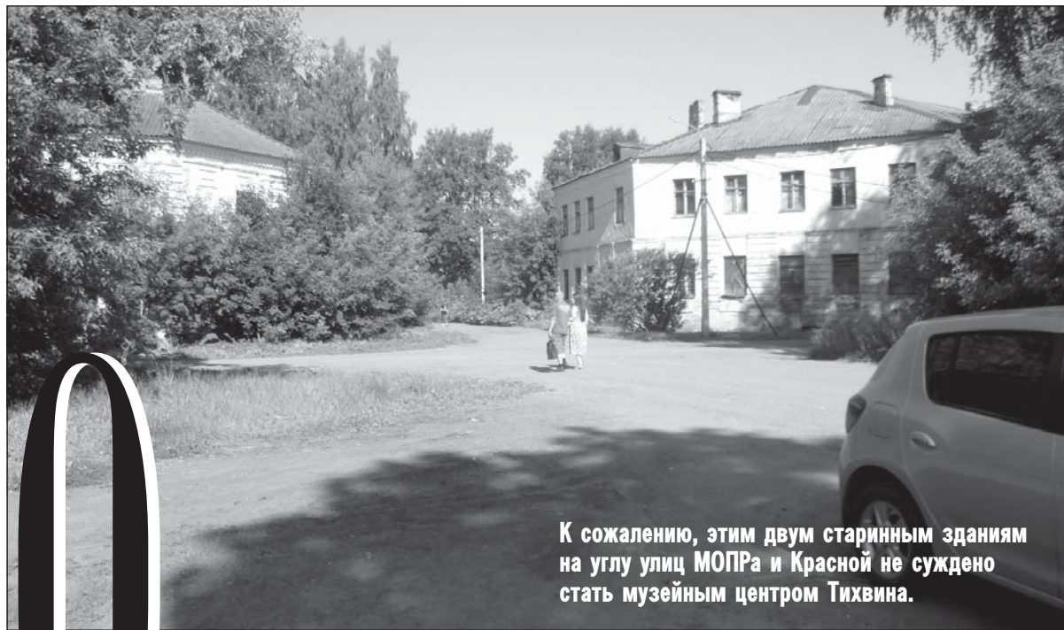
К сожалению, этим двум старинным зданиям на углу улиц МОПРа и Красной не суждено стать музейным центром Тихвина.