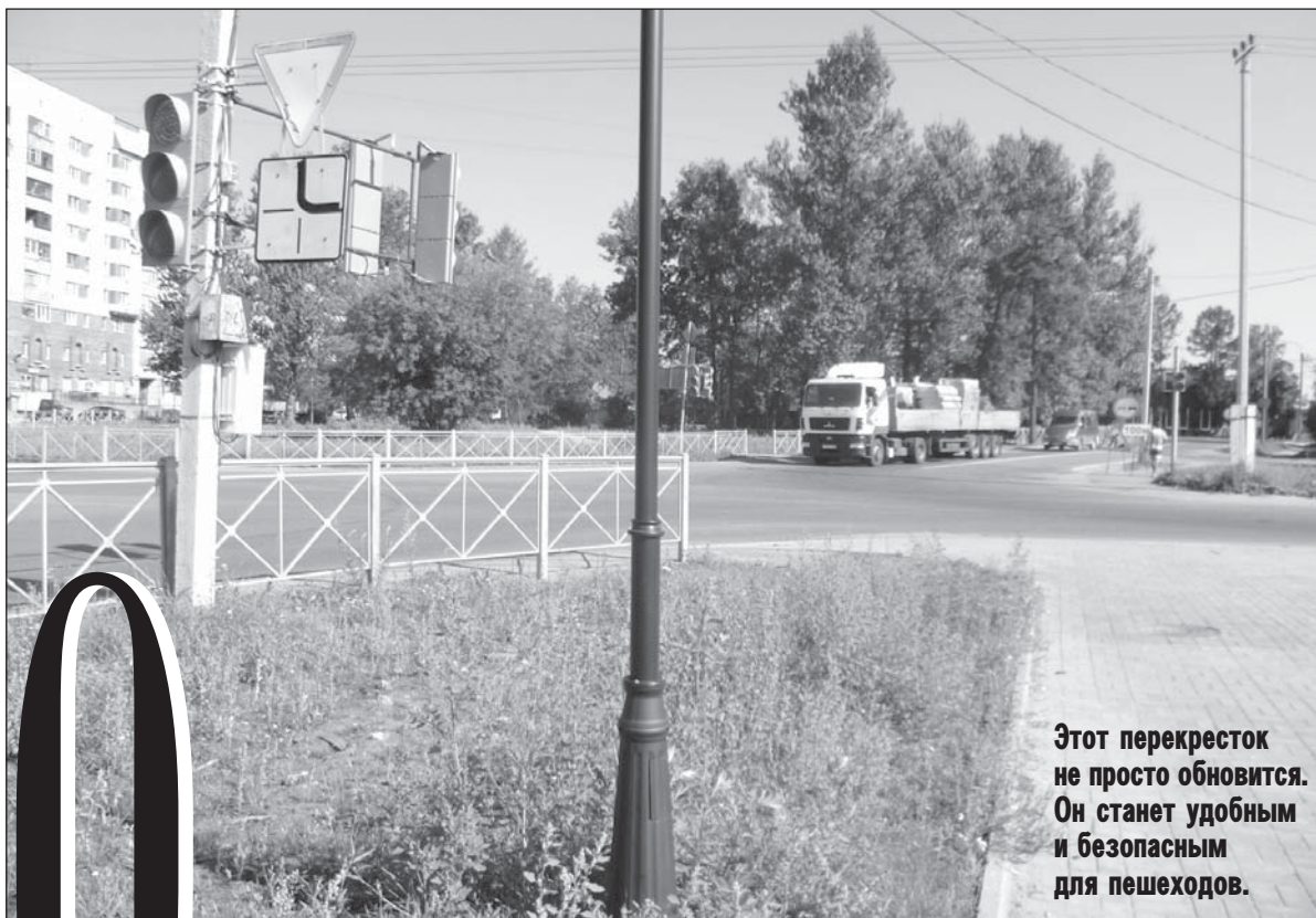
Этот перекресток не просто обновится. Он станет удобным и безопасным для пешеходов.