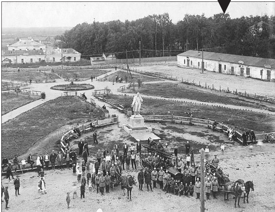
Полосу подготовили Алла ТИТОВА и Вера КРАСНОВА.