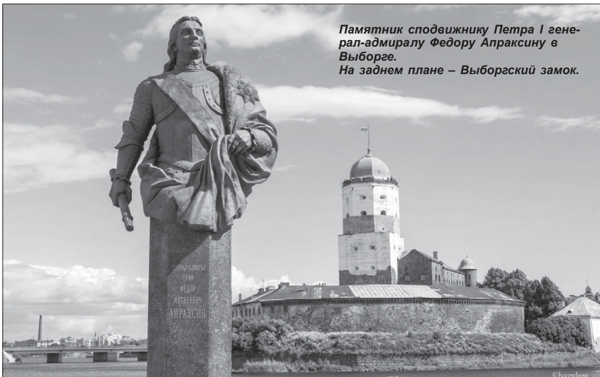
Памятник сподвижнику Петра I генерал-адмиралу Федору Апраксину в Выборге. На заднем плане – Выборгский замок.

Сергей БЕБЕНИН, председатель Законодательного собрания Ленинградской области.