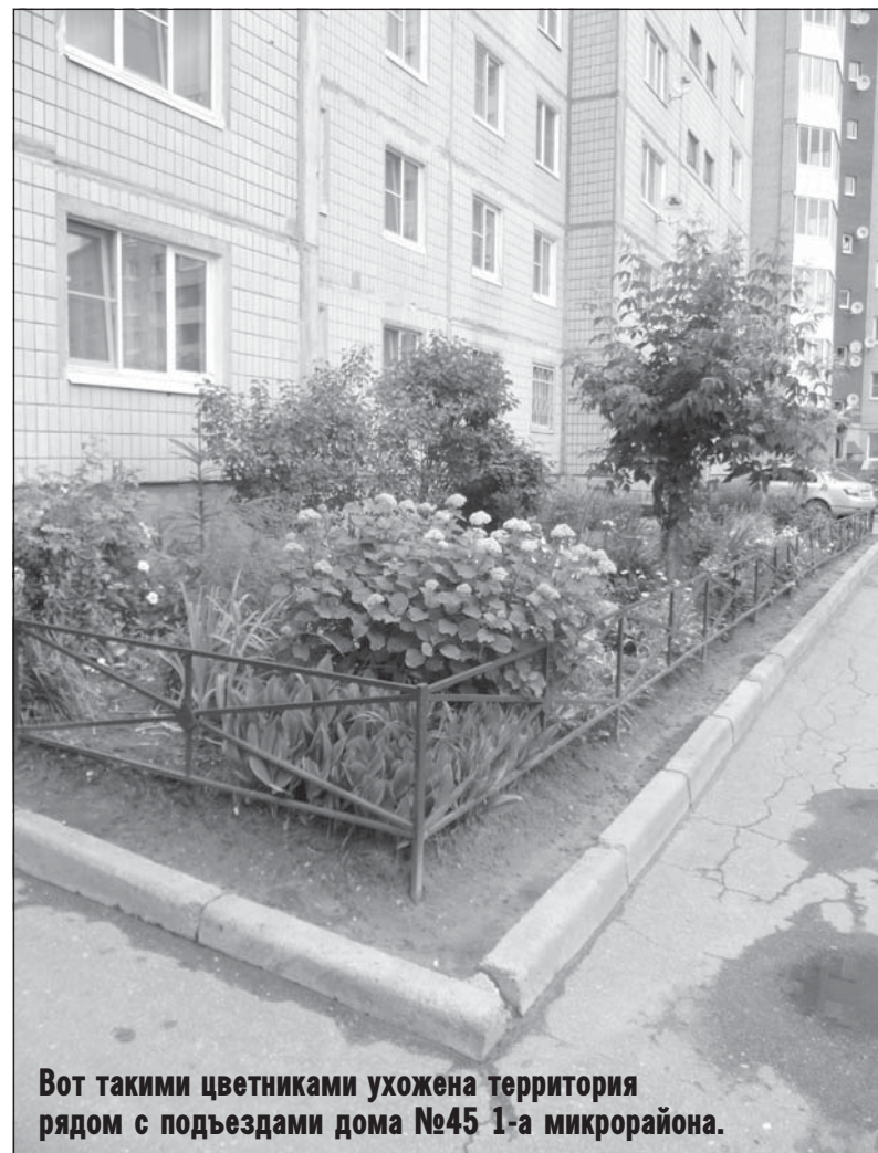
Вот такими цветниками ухожена территория рядом с подъездами дома №45 1-а микрорайона.