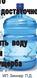
ИП Зиннер П.Д.

Наша вода – мягкая и приятная на вкус, при ее кипячении совершенно не образуется накипь. Ее можно пить без кипячения. Рекомендуется для приготовления пищи, для людей любого возраста, имеет достаточно низкий уровень минерализации, что позволяет пить воду в неограниченном количестве без ущерба для здоровья.