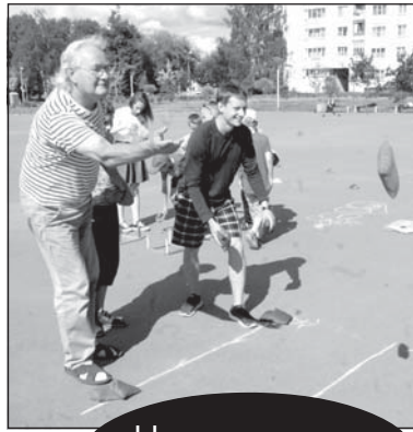
Не проходите МИМО

ПРОБЛЕМА наркомании является одной из актуальных как для здравоохранения, так и для общества в целом. Это обусловлено тяжелыми медицинскими и социальными последствиями злоупотребления наркотическими веществами, среди которых на первом месте находится деградация личности. Но наркомания — это не только трагедия отдельно взятого человека или семьи, это одна из причин демографического кризиса, рождения больных детей, снижения общего по-