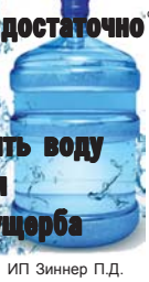
ИП Зиннер П.Д.

Наша вода – мягкая и приятная на вкус, при ее кипячении совершенно не образуется накипь. Ее можно пить без кипячения. Рекомендуется для приготовления пищи, для людей любого возраста, имеет достаточно низкий уровень минерализации, что позволяет пить воду в неограниченном количестве без ущерба для здоровья.