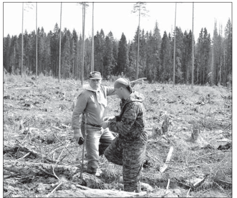
Материалы, отмеченные значком @, публикуются на правах рекламы.

Телефон/факс: 8 (813-66) 217-70, 219-84 . Электронная почта: bprinthouse@mail.ru Интернет-сайт: boxtip.ru