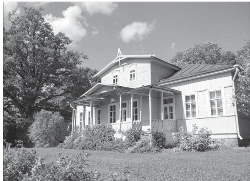
21 июня в 16 часов в Полковой церкви будет отслужена панихида и состоится концерт В ПАМЯТЬ О КОМПОЗИТОРЕ коллективов Детской школы искусств имени Н.А. Римского-Корсакова.