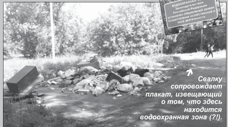
Свалку сопровождает плакат, извещающий о том, что здесь находится водоохранная зона (?!).

В ТОМ МЕСТЕ, где улица Чернышевская, разветвляясь, выходит на улицы Красную и Ращупкина, образовалась свалка бытового мусора. Естественно, не сама по себе. Кто-то, возможно, из близлежащих домов или расположенных неподалеку торговых точек прировнялся, не обременяя себя лишними хлопотами, прямо на траву выбрасывать всякий мусор и хлам. Читатель, отправивший на электронный адрес редакции этот снимок, надеется, что найдутся и ответственные за содержание этой территории, и те, кто загрязняет ее.