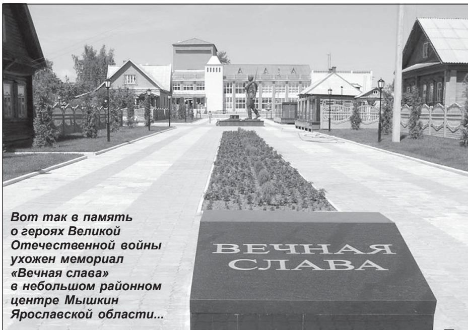
Вот так в память о героях Великой Отечественной войны ухожен мемориал «Вечная слава» в небольшом районном центре Мышкин Ярославской области...