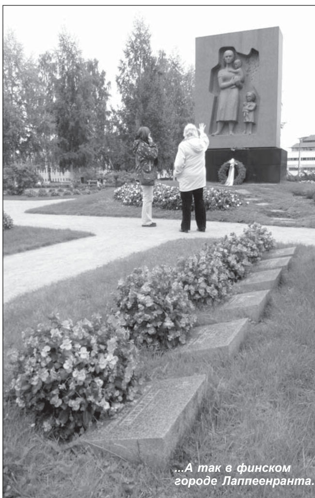
...А так в финском городе Лаппеенранта.

В Петрозаводске мемориал защитникам Родины на Карельском фронте вдоль гра-