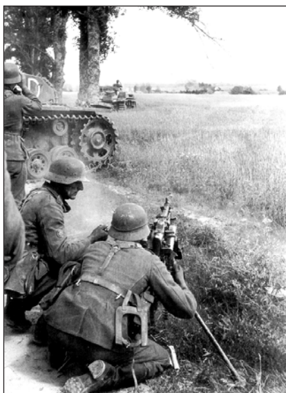
22 июня 1941 года. Враг вероломно вторгся на территорию СССР.

По всей стране проходят памятные мероприятия, возлагают цветы и венки к памятникам Великой Отечественной войны, проходит акция «Свеча памяти». Особо этот день отмечается в воинских частях Вооружённых Сил Российской Федерации.