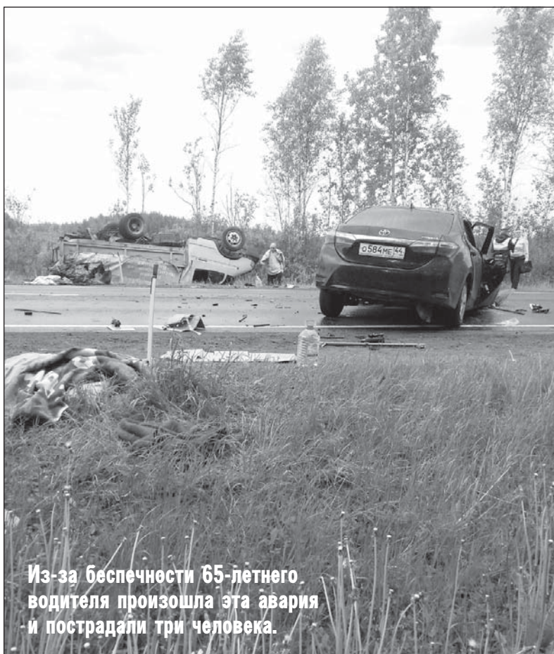
Из-за беспечности 65-летнего водителя произошла эта авария и пострадали три человека.

Электронная почта: bpriouthous@mail.ru . Интернет-сайт: boxtip.ru